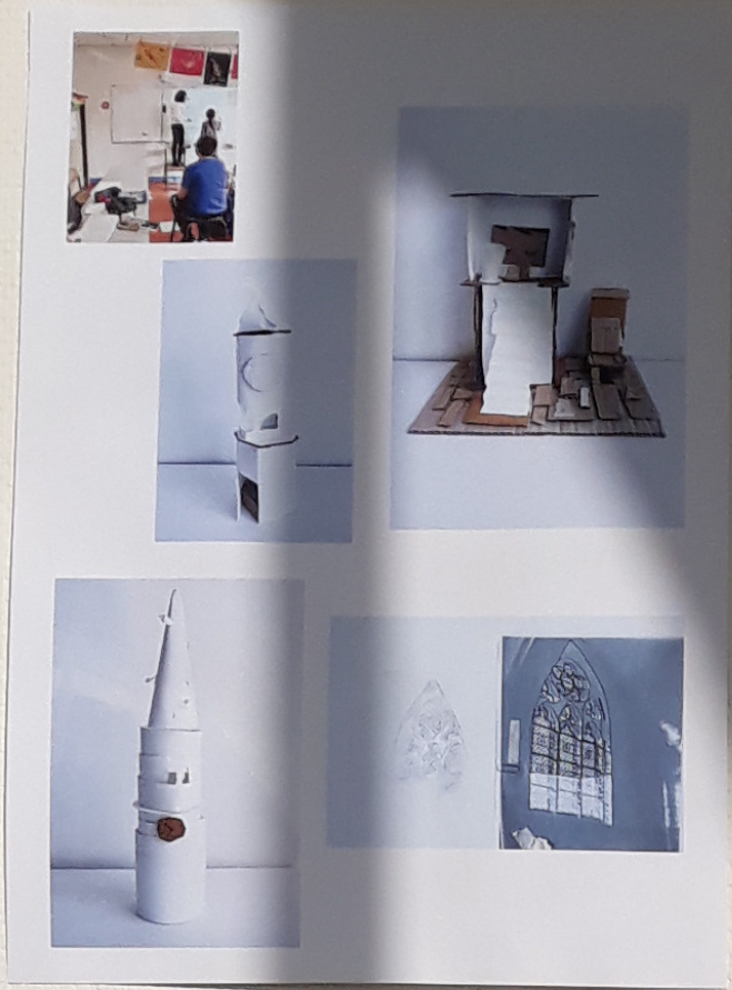
COLLEGE JEAN DE LA FONTAINE BOURGTHEROULDE (27)