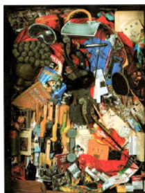
Arman, autoportrait , 1992.