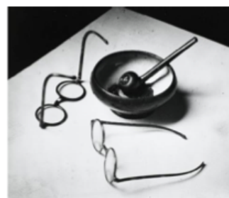
André Kertész, Pipe et lunettes de Mondrian , photographie, 1926