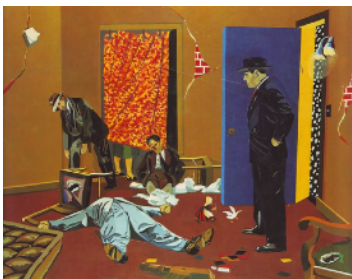
Eduardo Arroyo, Dichosos Quien Como Ulises , 1977.

Les élèves font des recherches sur le personnage choisi (tout en le gardant secret) et lister les INDICES (symbole, citations) à fabriquer ou récupérer. Il faut veiller à prendre en compte le dispositif et l' espace photographique . Il s'agit d'agencer les indices choisis pour produire et donner sens à l'oeuvre finale, en prenant en compte le lieu, l'environnement comme un indice supplémentaire.